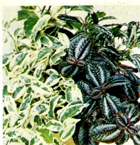
Ficus radicans variegata e Pilea cadierii